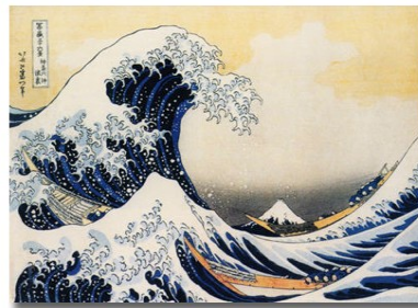
Impression toile vernie « la vague » 60 x 41 cm, sur châssis : 149,80 EUR