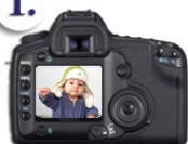
Photo de son appareil