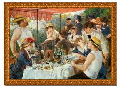
Huile sur toile « Le déjeuner des canotiers » 172 x 128 cm, avec cadre : 1.499,35 EUR