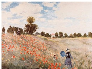
Affiche « Champ de coquelicots » 50 x 70 cm : 14,91 EUR

... en choisissant le type et format de reproduction, ainsi que l'encadrement.